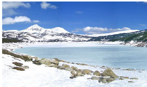
Lac des Bouillouses