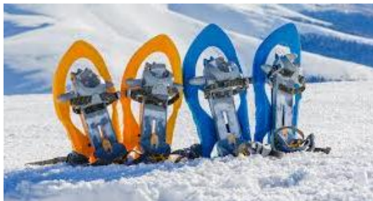
Raquettes à neige

L'hébergement principal (à définir) sera communiqué ultérieurement. Une nuit est prévue au refuge des Bouillouses.