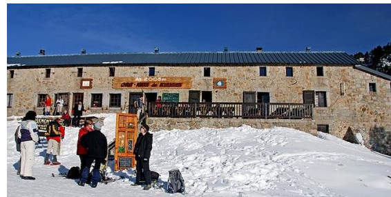
Refuge des Bouillouses