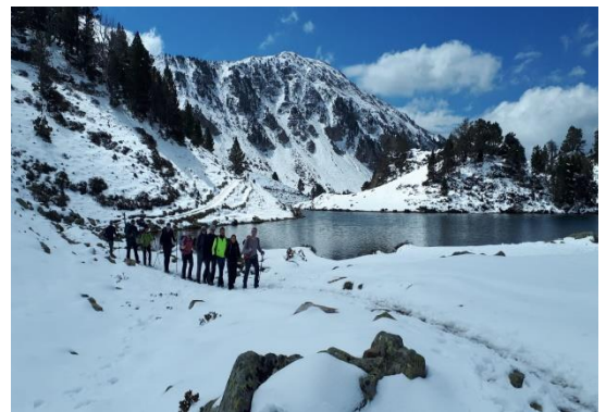
Pic de Pichaley