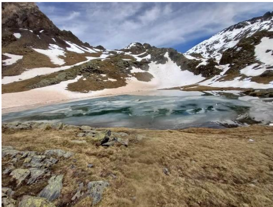
Lacs de Consaterre 2351m

Une vallée entourée de splendides lacs :