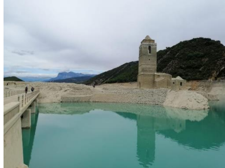
Lac de Mediano

Accès au versant Espagnol en cas de météo capricieuse côté français